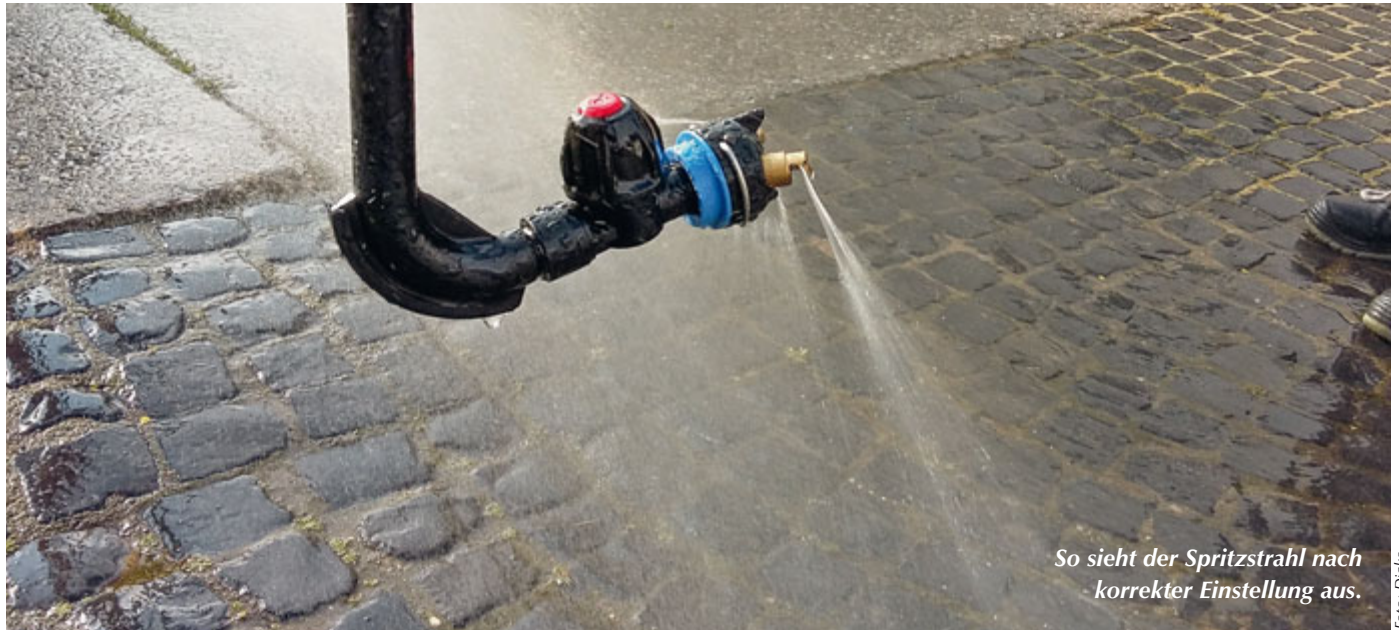
So sieht der Spritzstrahl nach korrekter Einstellung aus.